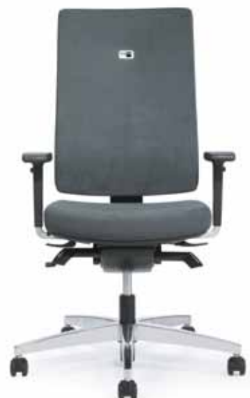
113.0000 + fk100-14 + al048-01